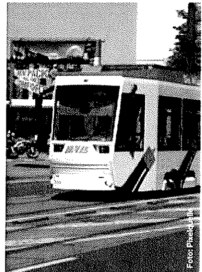
ÖPNV wird oft über Strompreise bzw. Netzentgelte in Querverbundsunternehmen subventioniert.

Beispielhaft sollen noch folgende Punkte kurze Erwähnung finden: Häufig besteht Streit über die Art und Weise der Kostenschlüsselung nach § 4 StromNEV, insbesondere die Schlüsselung und Zuordnung bestimmter Positionen zu Gemeinkosten. Auch die Art und Weise, wie Grundstücke als betriebsnotwendiges Anlagevermögen im Rahmen der Kostenkalkulation anzusetzen sind ,